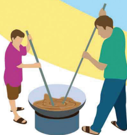
การทำน้ำตาลมะพร้าว