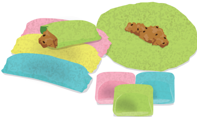
ขนมเกสรดอกไม้เจียก

เด็กและเยาวชนบ้านแสนแก้ว ตำบลสวาย อำเภอปรางค์กู่ จังหวัดศรีสะเกษ ขาดโอกาสในการศึกษาต่อ ส่งผลให้หลายคนไม่มีงานทำ กลุ่มเยาวชนจึงใช้ “ฐานทุน” ที่มีอยู่ในชุมชนที่มีจุดเด่นเรื่องเกษตรกรรม และภูมิปัญญาท้องถิ่นมาเป็นโจทย์ในการทำโครงการเด็กแสนร่วมใจ สร้างรายได้ เสริมชีวิต โดยหวังว่าโครงการนี้จะทำให้เด็กและเยาวชนในชุมชนได้เรียนรู้เรื่องการสร้างอาชีพ เกิดแหล่งอาหาร พร้อมสร้างรายได้แก่ตัวเองและชุมชน