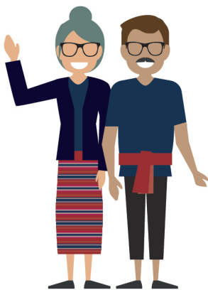
ผู้ใหญ่ในชุมชน