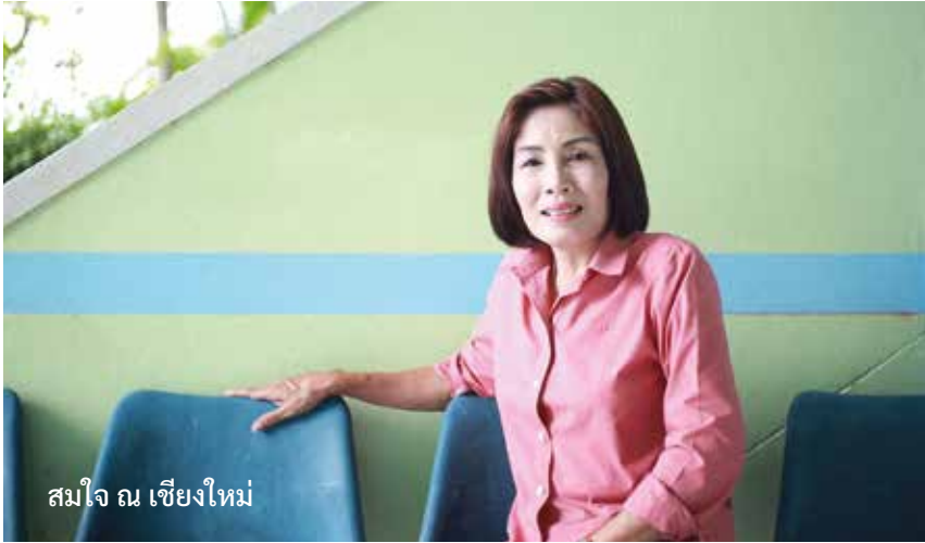
สมใจ ณ เชียงใหม่

การสรุปวิเคราะห์ข้อมูล เพื่อกำหนดทางเลือกและวางแผนปฏิบัติการ เมื่อโจทย์งานวิจัย คือ การสร้างอาชีพ การสำรวจต้นทุนอาชีพในชุมชนจึงเป็นเรื่องสำคัญ