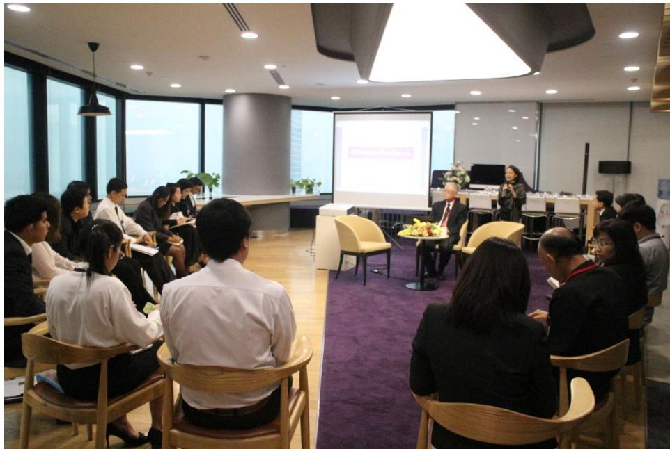
บรรยากาศเวทีเสวนา

ผมเดาว่า SP หลายคนค่อนข้างวิ่งไปชนกำแพงใช้ใหม่ หนามากน้อยแค่ไหน พุดง่าย ๆ ก็คือไปเจอ Obstacle เจอ เสดดอล (Hurdle เครื่องกีดขวาง) ที่จะต้องเผชิญ ซึ่งนั่นคือ Exercise ของ Leader หรือ Change Agent ถ้าใครก็ตามทำงาน เพื่อสร้าง Change แล้ว การต้องเผชิญ เสดดอล (Hurdle เครื่องกีดขวาง) เหล่านั้น หากไม่สูงมาก Exercise ก็น้อย ความแข็งแกร่งที่จะได้จากการที่เราอาสาทำงานนี้ก็ไม่ได้ไม่มาก เพราะฉะนั้นผมมองว่าการที่เราไปเจอ เสดดอล (Hurdle เครื่องกีดขวาง) ค่อนข้างสูง น่าจะถูกแล้ว น่าจะเป็นสิ่งที่ทำให้พวกเราได้เปรียบมากอย่างแท้จริง ก็ที่ผมจะนำเสนอเพื่อให้เห็น เสดดอล (Hurdle เครื่องกีดขวาง) ของการศึกษาไทย แต่จากมุมมองของผมนะครับ