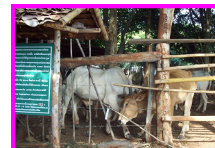
การเลี้ยงวัว ควาย