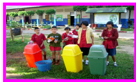
การคัดแยกขยะ