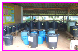
จุลินทรีย์ชีวภาพ(EM)