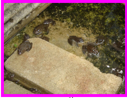
การเลี้ยงกบ