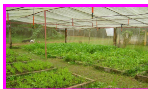
การปลูกพืชผักสวนครัว