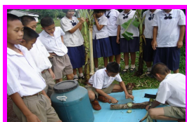
น้ำส้มควันไม้