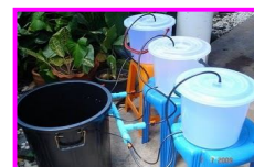
การเพาะถั่วงอก