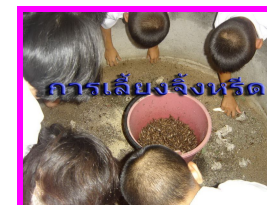
การเลี้ยงจิ้งหรีด