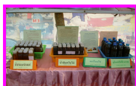
การทำน้ำยาเอนกประสงค์