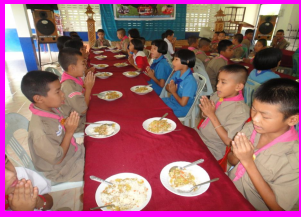
อาหารกลางวันแบบพอเพียง(บุฟเฟต์)