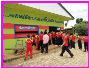
สหกรณ์ร้านค้าโรงเรียน

แผนการจัดการเรียนรู้บูรณาการ หลักปรัชญาของเศรษฐกิจพอเพียง กลุ่มสาระการเรียนรู้คณิตศาสตร์ ชั้นประถมศึกษาปีที่ 3 เรื่อง การวัด