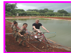
จักรยานปั่นน้ำ