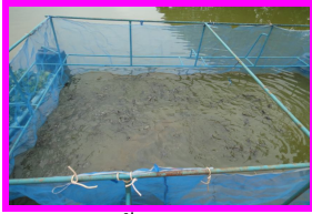
การเลี้ยงปลาดุก