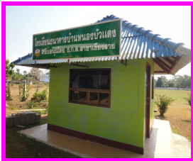
ธนาคาร โรงเรียน