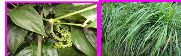
การปลูกสมุนไพร

3. ด้านปศุสัตว์ ประกอบด้วยฐานการเรียนรู้