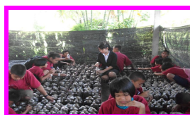
การเพาะเห็ดนางฟ้า