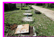
บ่อบำบัดน้ำเสีย

2. ด้านพืช ประกอบด้วยฐานการเรียนรู้จำนวน