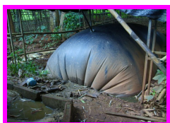
แก๊สชีวภาพจากมูลสัตว์

1. ด้านสิ่งแวดล้อม ประกอบด้วยฐานการเรียนรู้จำนวน 8 ฐาน ได้แก่