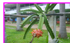
แก้วมังกร