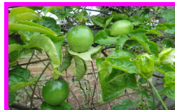
การปลูกเสาวรส