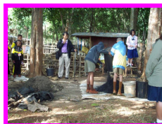
การทำปุ๋ยโบกาฉิ