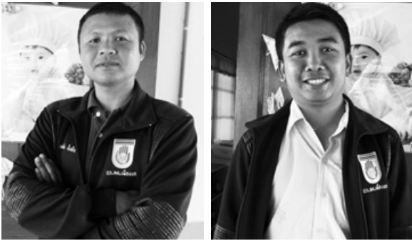
เผด็จ ยิ่งยืน

แม้จุดเริ่มต้นของทีมนักกักตวจุมน ชน ทต.เมืองแกจะไม่สวยงามเหมือนทีมอื่นๆ แต่เมื่อพวกเขา “เปิดใจ” พร้อมรับ “ความรู้” ที่มีในหลักสูตร ความสวยงามงดงามที่อยู่ในตัวของนักกักตวจุมนทีมนี้ก็เริ่ม “เปล่งประกาย” กลายเป็น “พลังบวก” ให้พวกเขาหันมาทำงาน “กักตจ” และ “เชื่อมร้อย” ทุกภาคส่วน ในชุมชนตำบลเมืองแกให้เข้ามามีส่วนร่วมในการแก้ปัญหาเด็กและเยาวชนได้ในที่สุด