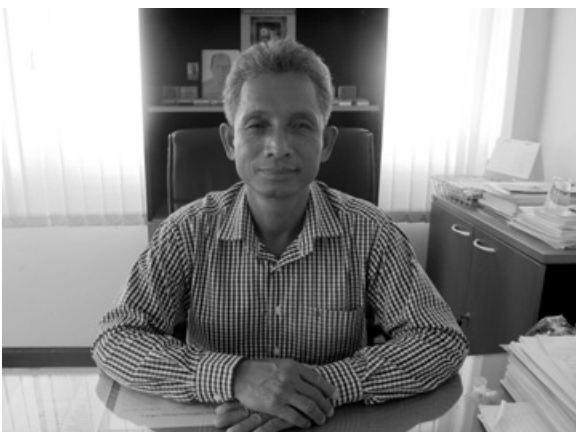
“เชื่อมร้อยและถักทอ”

“ถามว่าเสียใจไหมที่ต้องเปลี่ยนทีมทำงานบ่อยๆ ก็เสียใจนะ เพราะในฐานะหัวหน้าทีมเราไม่สามารถทำให้เพื่อนร่วมทีมคิดแบบเดียวกับเราได้ ก็ต้องปล่อยเขาไป เพราะวันนี้เขาอาจจะยังไม่เห็นประโยชน์ของหลักสูตรนี้ก็ได้”