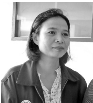
เนตรทราย ถิ่นถาวร