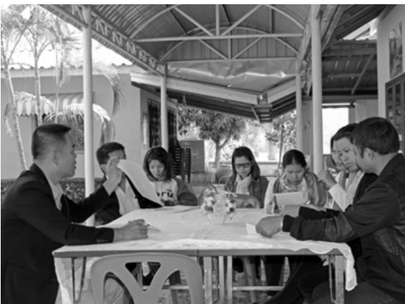
“เชื่อมร้อยและถักทอ”

หาก “เป้าหมาย” ของการอบรมหลักสูตรนักถักทอชุมชนคือ การเปลี่ยน “วิถีคิด วิถีการทำงาน” และหลังผ่านการอบรมไปแล้ว ผู้เข้ารับการอบรมจะมีทักษะการทำงานมากขึ้น มีวิธีการทำงานที่เปลี่ยนไปจากเดิม