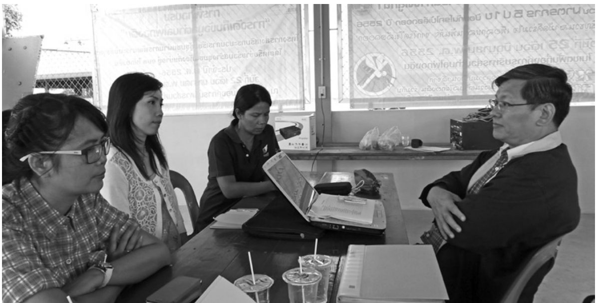
“เชื่อมร้อยและถักทอ”

“ตอนแรกก็ยังไม่คิดไม่ออกว่าจะทำอะไร จึงใช้ทักษะความรู้ที่ได้จากการอบรม คือการจัดประชุมเพื่อระดมความเห็นจากชุมชน ครั้งแรกเชิญผู้นำทั้งตำบล ทั้งนายก อบต.