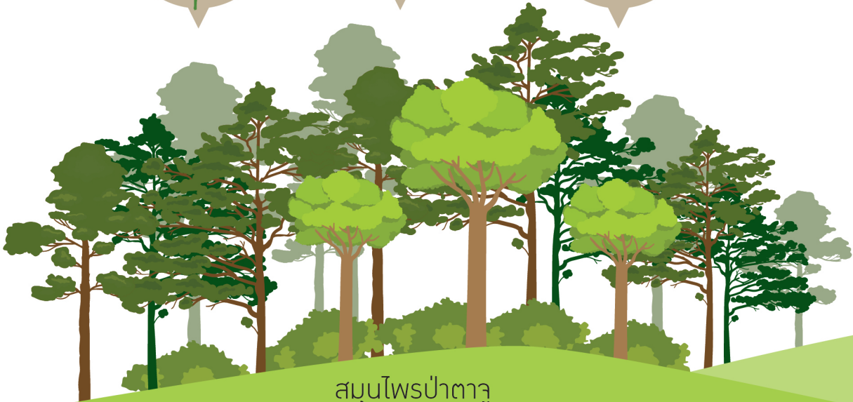
สมุนไพรป่าตาวู

เป้าหมายของโครงการ สร้างมายั่งยืน ความเป้าหมาย 2 ระดับ