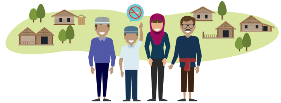
อยากเห็นชุมชนปลอดยาเสพติด