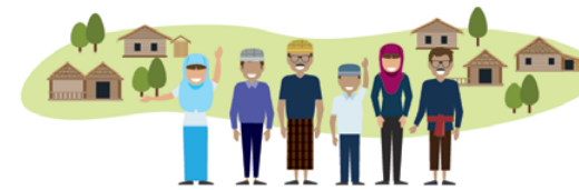
ชุมชนปลอดยาเสพติด