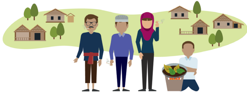
ชุมชนติดยาเสพติด

เพราะเคยศึกษาประวัติศาสตร์ของชุมชนบ้านสะนอ อำเภอยะรัง จังหวัดปัตตานี มาก่อน ทำให้กลุ่มเยาวชนเห็นปัญหาของชุมชนที่เด็กเยาวชนในชุมชนหลงผิดก้าวเข้าสู่เส้นทางการเสพติดเป็นจำนวนมาก จึงจัดทำ โครงการศาสนานำพาชีวิต ที่มีเป้าหมายเพื่อลดกลุ่มเสี่ยงจากการติดสารเสพติดในชุมชน โดยนำวิถีทางศาสนามาเป็นเครื่องมือ