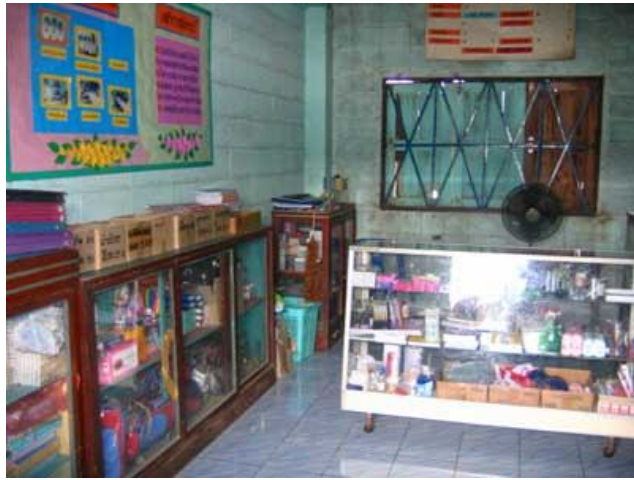
บรรยากาศในสหกรณ์ร้านค้า