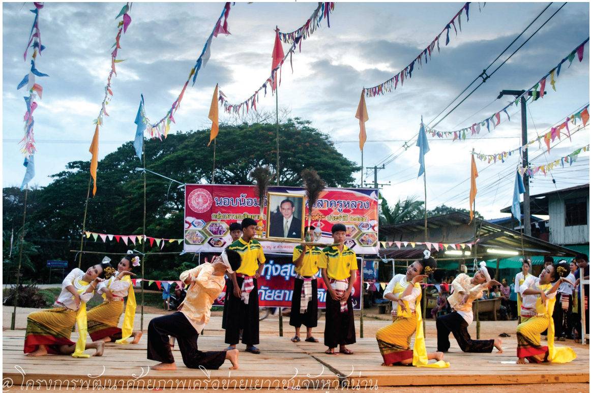
๑ โครงการพัฒนาศักยภาพเครือข่ายเยาวชนจังหวัดน่าน

นึกก็ เล่าต่อว่า ตอนแรกไม่รู้ว่าการทำโครงการเป็น อย่างไร แต่พอลองพี่ๆ เขาก็ถามกลับว่า พวกเราอยากทำ โครงการเกี่ยวกับอะไร ตอนแรกคิดทำเรื่องการเดินแถว แต่คิดว่า มันเป็นกิจกรรมที่โรงเรียนทำอยู่แล้ว จึงระดม ความคิดกันว่าจะทำอะไรดี จนได้เป็นโครงการฟื้นฟูไร้ ฝีมือและทอผ้า เพราะพวกเขาส่วนใหญ่ชอบงานด้านวัฒนธรรม กันอยู่แล้ว