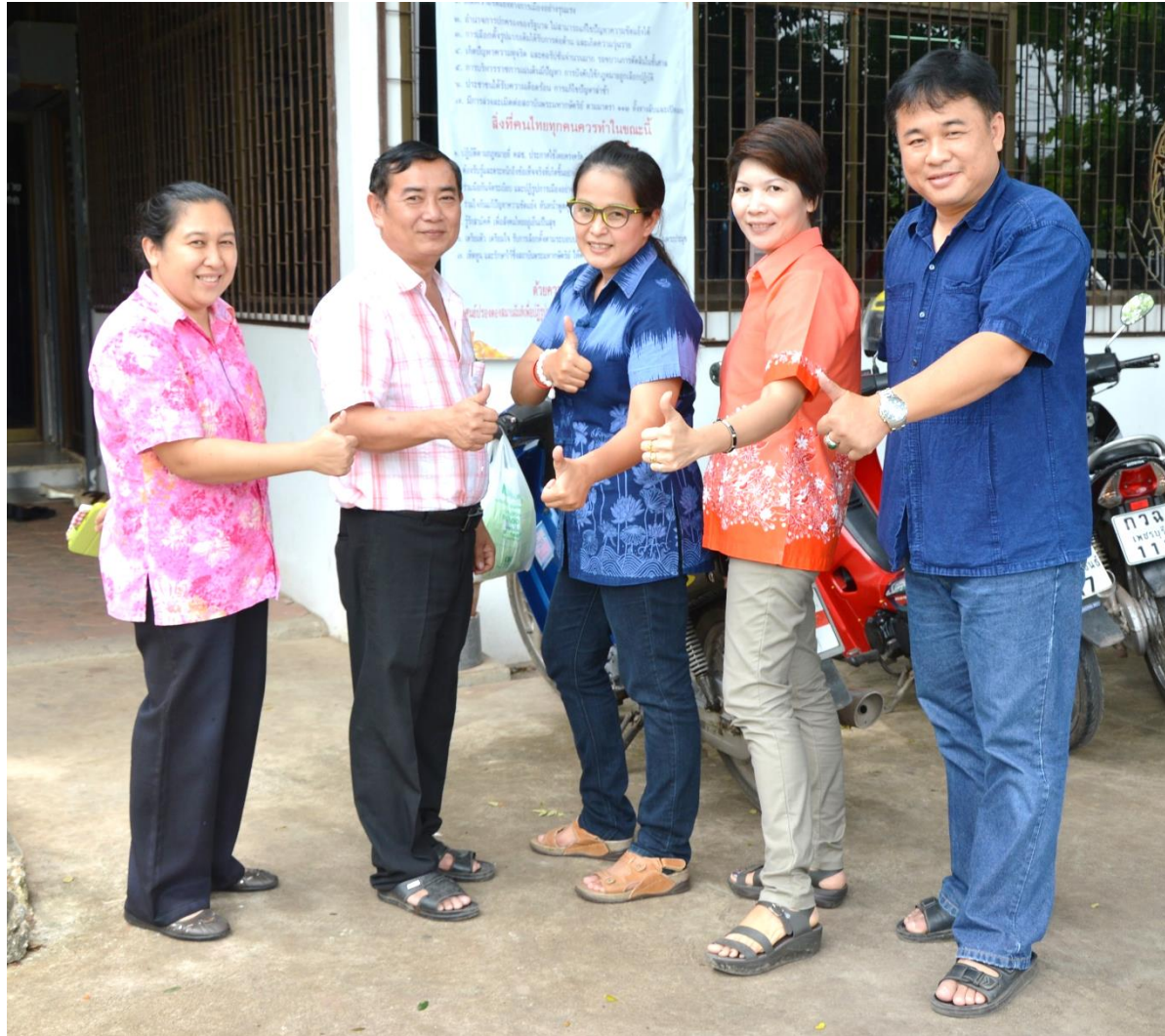
อบต. ปลายโพงพาง อ.เมือง จ.สมุทรสงคราม