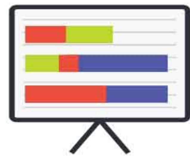
กำหนดเป้าหมายโครงการ