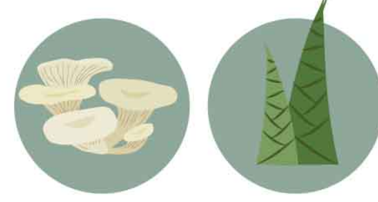
เก็บข้อมูลพืชอาหารในป่า สำรวจแหล่งน้ำ

ทีมงานคาดหวังว่า โครงการเส้นทางศึกษารรรมชาติป่าชุมชนบ้านหวนา จะต้องสร้างความเปลี่ยนแปลงให้เกิดขึ้น 2 ระดับ ได้แก่