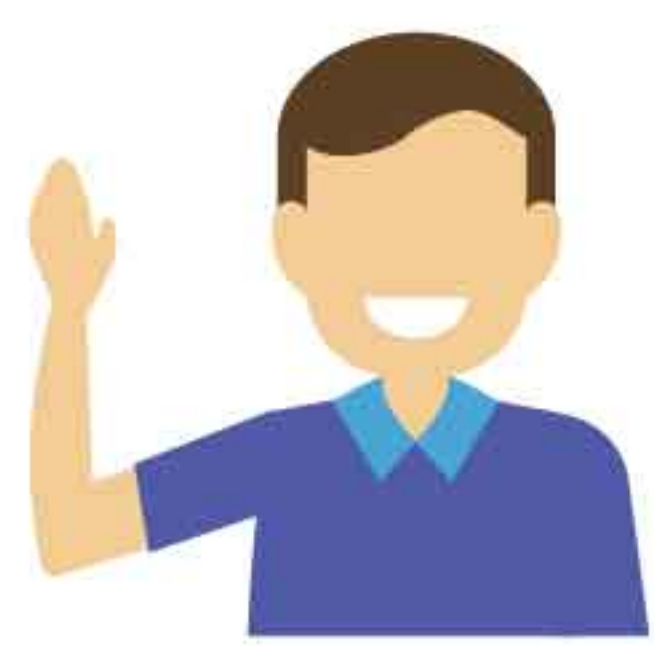
หาแนวร่วม