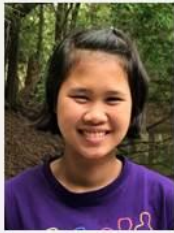
กัญชติพาพรรณ ราชสาส์