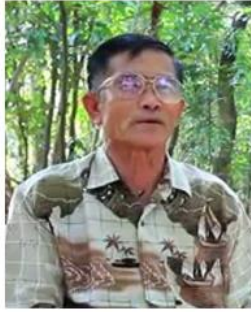
พ่อคำเตื่อง ภาซี